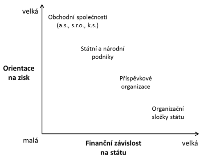
Obrázek 2: Přehled právních forem společností, podniků a organizací ve vlastnictví státu, jejich hlavní úkoly a vazba na stát

Vedle obchodních společností a státních podniků zřizuje stát za účelem zajištění veřejných služeb či k zajištění vlastního chodu státní příspěvkové organizace, jakožto právnické osoby, a organizační složky státu, které samy o sobě právními osobami nejsou. Tyto státní instituce jsou ve své podstatě neziskové, i když některé kryjí alespoň část provozních nákladů ze svých příjmů.