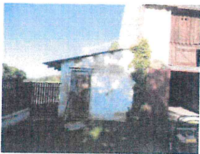
St. 104 -pohled východní