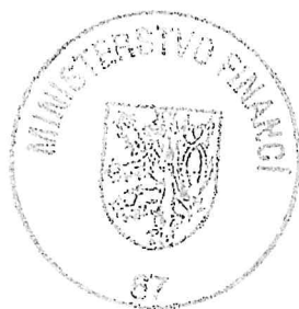
Mgr. Ondřej Landa náměstek ministra

Tímto rozhodnutím byl privatizační projekt, vedený v evidenci Ministerstva financí pod č. 86739, zpracovaný Státním pozemkovým úřadem, vybrán k realizaci.