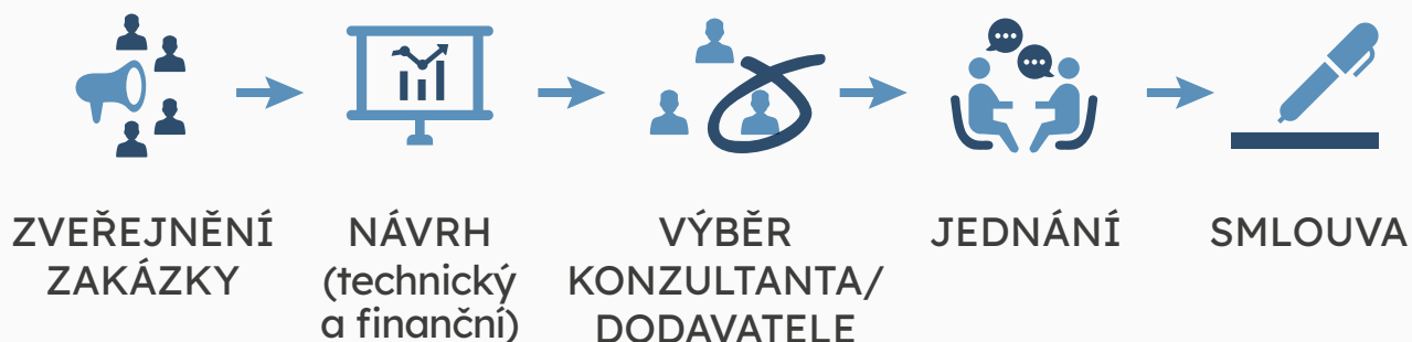
SCHÉMA DVOUSTUPŇOVÉHO VÝBĚROVÉHO ŘÍZENÍ: