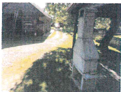
Přístupová cesta přes st. 43/1, ppč. 20