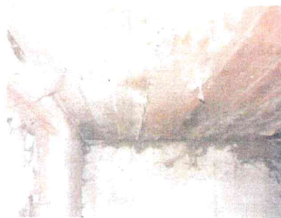
st. 104 – interier-strop