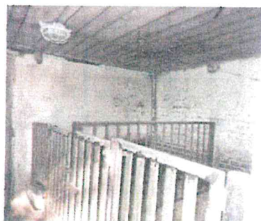
st. 104 – stavba interier