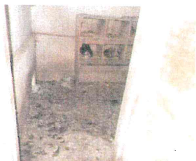
St. 104 a st. 105 – interier