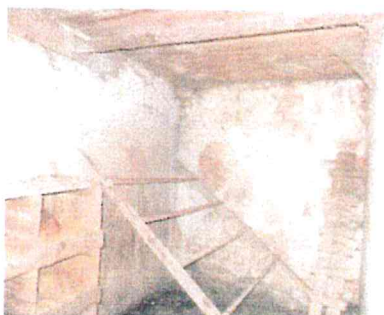
St. 104 a st. 105 - interier