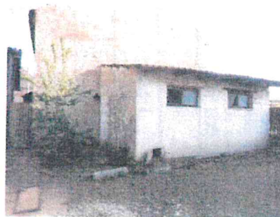
st. 104 a st. 105 – pohled JZ