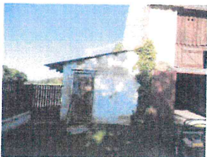
St. 104 -pohled východní