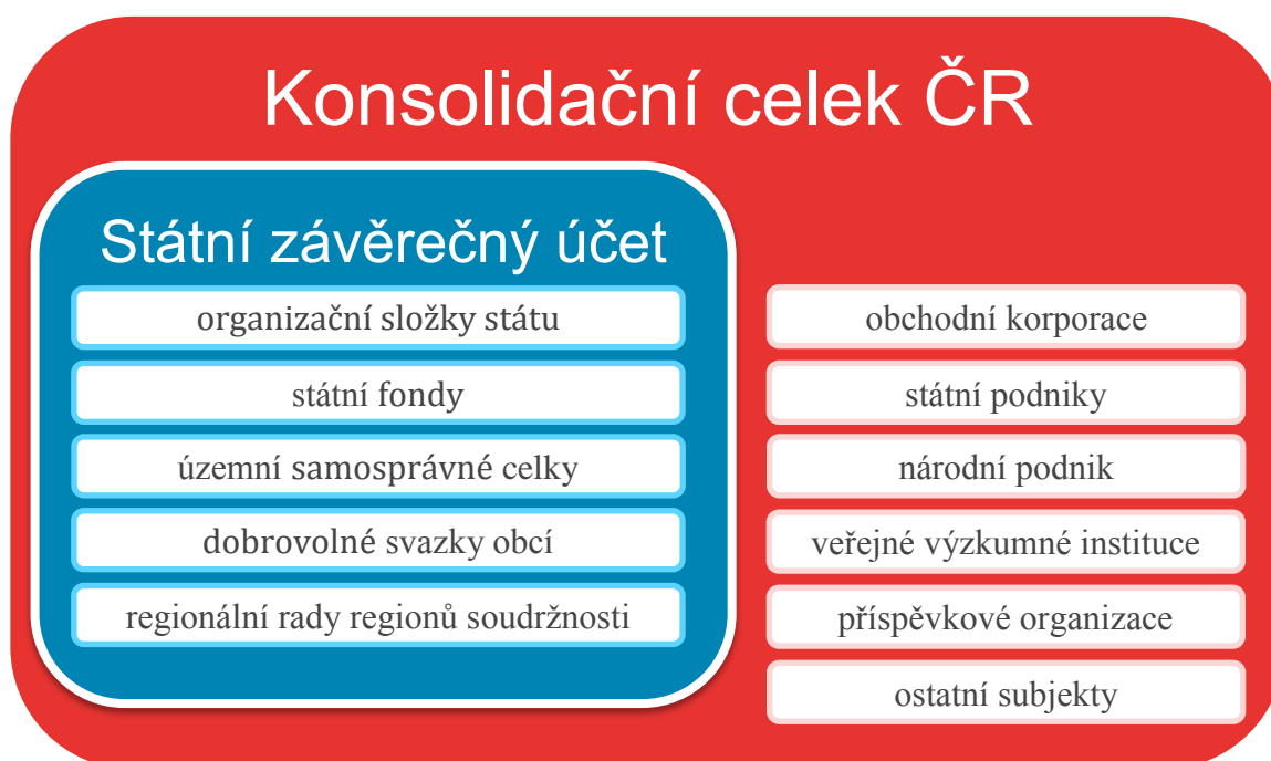
Obrázek 1 - Účetní jednotky konsolidačního celku ČR ve vazbě na Státní závěrečný účet

Hodnoty údajů ve Státním závěrečném účtu ČR nemusejí odpovídat hodnotám obdobných údajů v konsolidovaných výkazech za Českou republiku, jelikož dochází k uplatňování odlišnýchází, a to peněžní báze prostřednictvím rozpočtu u Státního závěrečného účtu a aktuální báze prostřednictvím účetnictví u účetní konsolidace státu. Na rozdílnost hodnot mají navíc vliv i konsolidační operace.