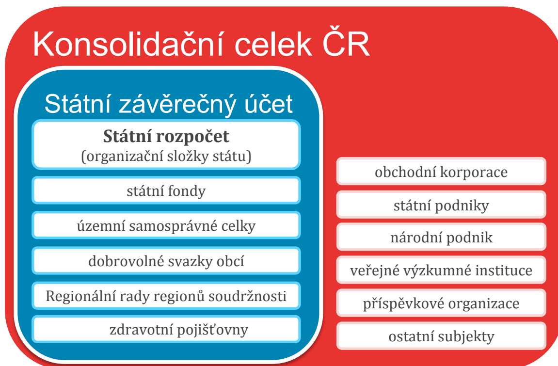
Obrázek 2 - Účetní jednotky konsolidačního celku ČR ve vazbě na Státní závěrečný účet

Vzhledem k tomu, že Státní závěrečný účet hodnotí výsledky hospodaření na peněžní bázi a souhrnné výkazy za Českou republiku se sestavují na aktuální bázi, nemusejí si hodnoty u obdobných položek těchto dokumentů navzájem odpovídat. Na rozdílnost hodnot má navíc vliv i odlišnost obou celků.