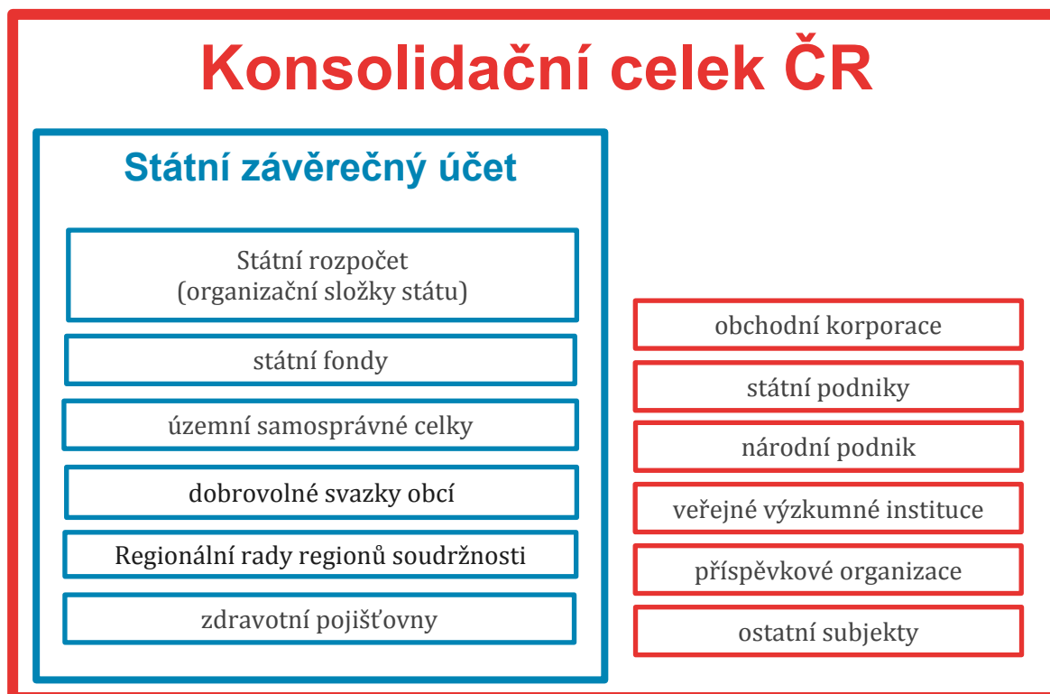
Schéma 1 - Účetní jednotky Konsolidačního celku ČR v porovnání na Státní závěrečný účet

Vzhledem k tomu, že Státní závěrečný účet hodnotí výsledky hospodaření na peněžní bázi a souhrnné výkazy za Českou republiku se sestavují na akruální bázi, nemusejí si hodnoty u obdobných položek těchto dokumentů navzájem odpovídat. Na rozdílnost hodnot má navíc vliv i odlišnost obou celků.