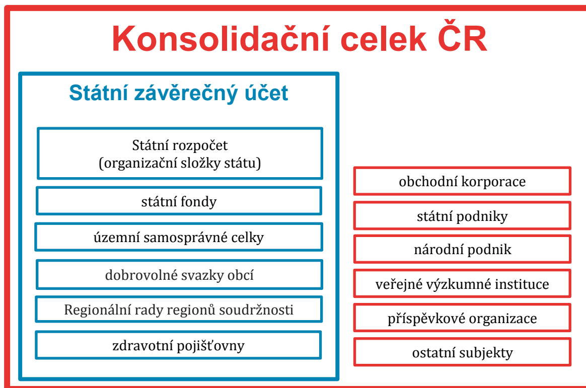
Schéma 1 - Účetní jednotky Konsolidačního celku Česká republika v porovnání na Státní závěrečný účet

Vzhledem k tomu, že Státní závěrečný účet hodnotí výsledky hospodaření na peněžní bázi a účetní výkazy za Českou republiku se sestavují na akruální bázi, nemusejí si hodnoty u obdobných položek těchto dokumentů navzájem odpovídat. Na rozdílnost hodnot má navíc vliv i odlišnost obou celků.